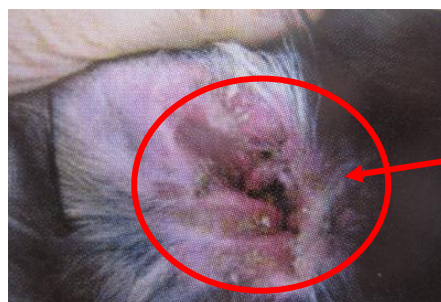
外耳炎を起こしている耳